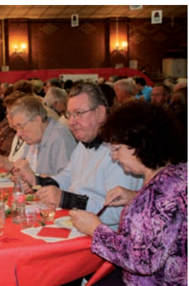
horizons étaient également de la

de la dernière fête de la Rose à Orchies