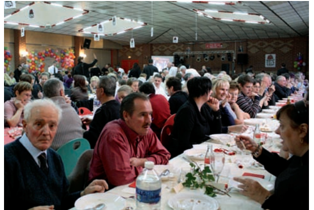
Les représentants de différentes sections étaient venus nombreux.