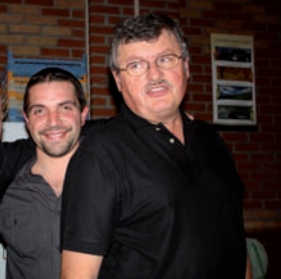
onsables du bar.