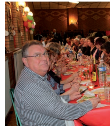
Monde associatif et bénévoles de tous h fête.