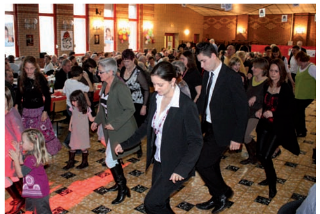
Tout le monde sur la piste durant toute l'après-midi.