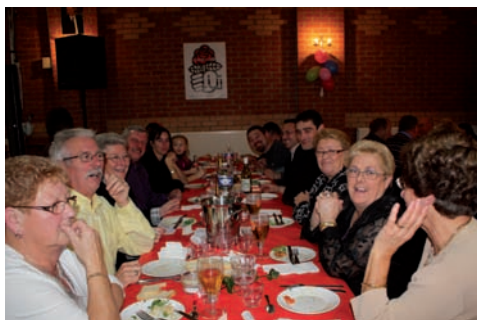
Elus, militants et amis, une occasion de se rencontrer et de partager.