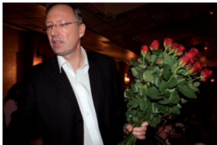
Traditionnellement, une rose est offerte à toutes les femmes présentes.