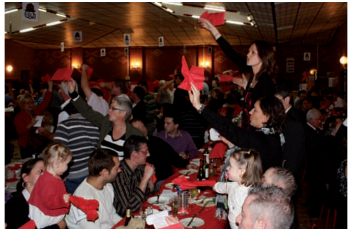
Le Chiffon Rouge, chant de ralliement des militants et sympathisants.