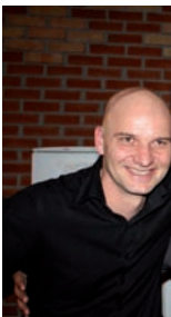
Les bénévoles resp