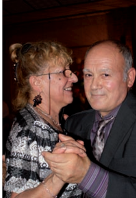
Repas et danse au programme de la Fête.