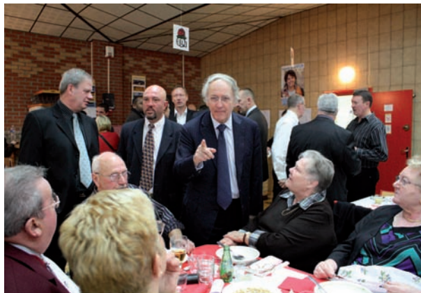
Les Pourchots en pleine discussion avec le Président du Conseil Régional