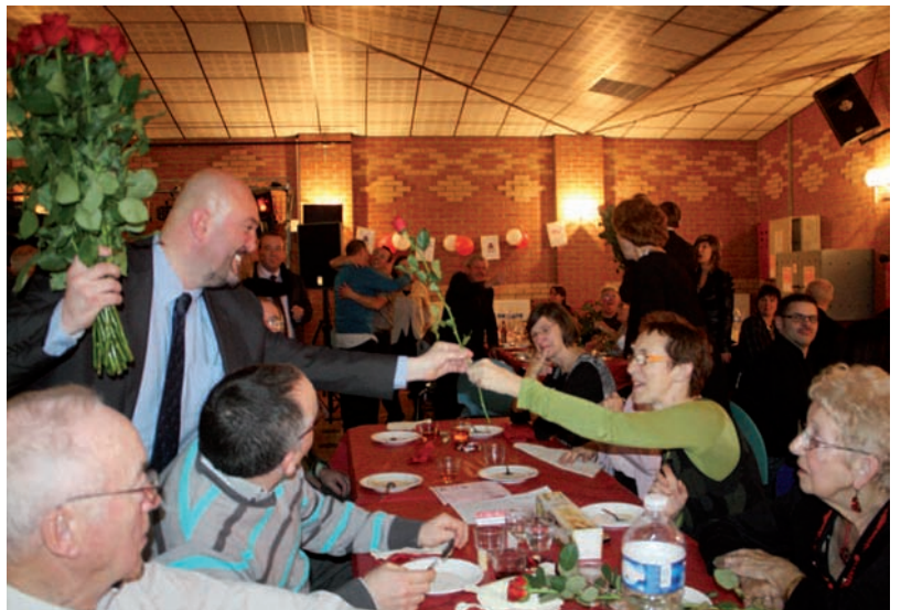
Traditionnellement, une rose est offerte à toutes les femmes présentes.