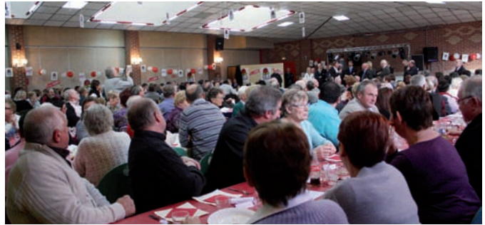
Militants, sympathisants, représentants associatifs, citoyens se sont retrouvés pour ce moment de convivialité.