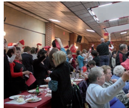
Le Chiffon Rouge, moment important et traditionnel de la Fête de la Rose.