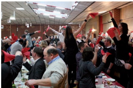
el de la Fête de la