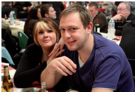
La Fête de la Rose rassemble chaque année toutes les générations.